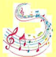
緑風デイサービスセンター

7月6日に優文小学校交流会がありました。17名の児童が来て、手作りのビンゴゲームと一緒にしたり、演劇「たのきゆう」歌「ハッピー・ラッキーグッデー」を披露して頂きました。最後に手作りの「しずおり」のプレゼントを頂き喜ばれており、笑顔がみられました。良い交流会になりました。