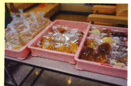
特別養護老人ホーム 緑風館