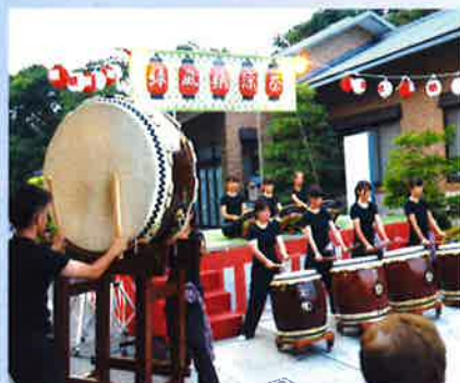
淡路三原高校 和太鼓部