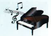
特別養護老人ホーム 緑風館

毎週木曜日の午後、「ウインズ・きらら」から焼きたてパンとお菓子を緑風館に売りに来て頂いています。 ウインズ・きららのパンは、素材・味・食感にこだわり丁寧に手作りをしており、「デニッシュ生地を使用した商品」「ふわパンシリーズ」が定番の人気商品です。 普段は、ショッピングをする機会が少ないので色々な種類のパンから選んで買う事が出来て嬉しそうです。 利用者の方々に訪問販売は、大変好評です。 これから、季節限定のパン等、楽しみにしていますので宜しくお願いします。