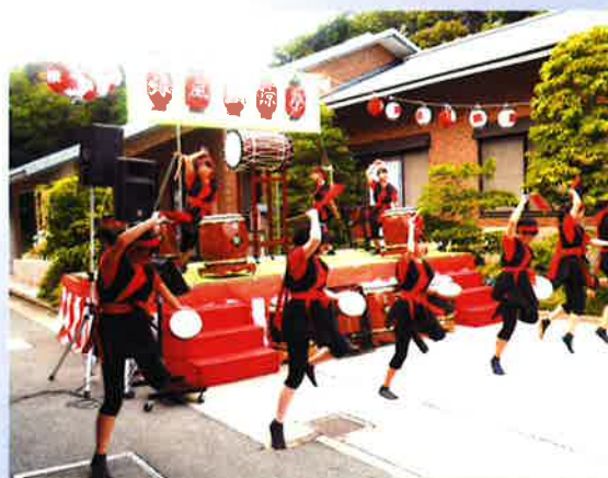
倭文中学校 音楽部