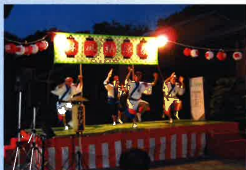
パナソニックエナジーかけはし連